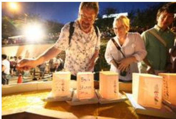
灯籠作り体験スペース (イメージ)