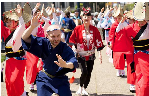
阿波踊り体験スペース (イメージ)