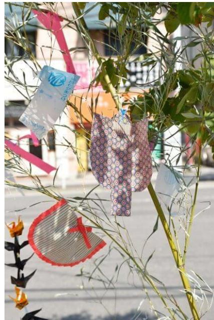
七夕飾り作成スペース (イメージ)